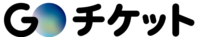
1行ロゴ (プライマリー)